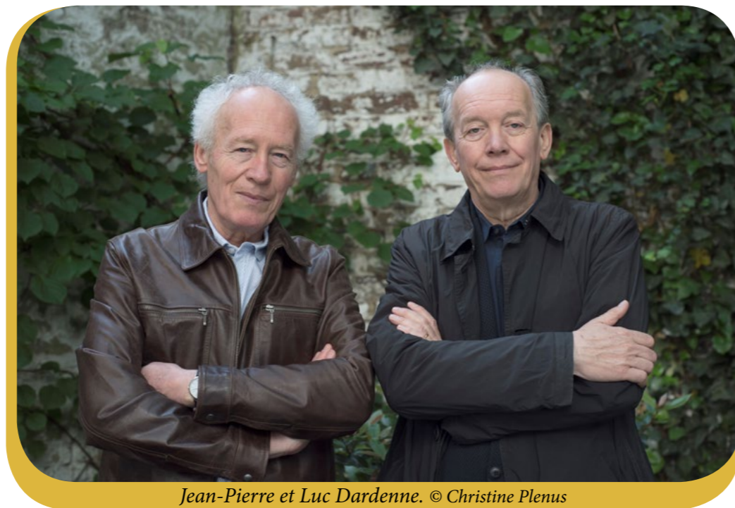
Jean-Pierre et Luc Dardenne.

Les frères Dardenne figurent parmi les grands représentants du cinéma social européen . Leurs films renouvellent l'esthétique et la narration grâce à un style concret et épuré.