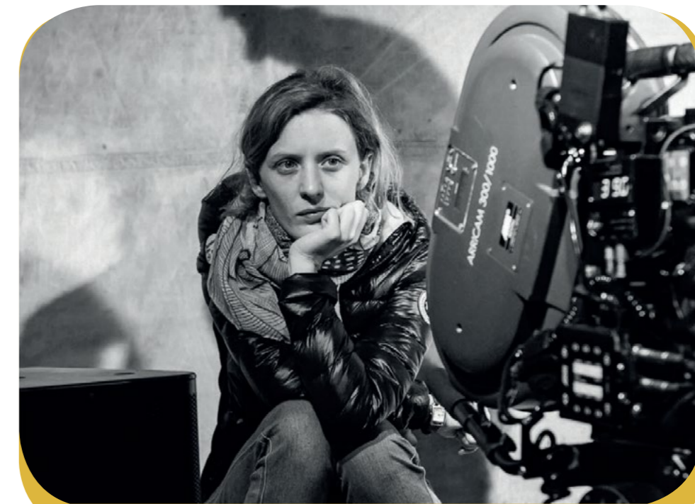
Mia Hansen-Løve.