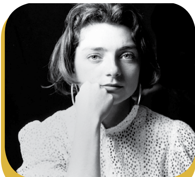
Solveig Anspach.

R éalisatrice americano-islandaise diplômée de la Fémis, Sólveig Anspach fut l'invitée à plusieurs reprises entre 1997 et 2012 de notre festival, dont elle était devenue membre du comité de parrainage. Décédée en 2015 à l'âge de 54 ans, elle laisse derrière elle une filmographie subtile et intimiste. Son dernier film L'Effet aquatique lui a valu à titre posthume un César du meilleur scénario.