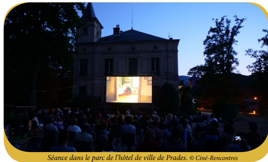
Séance dans le parc de l'hôtel de ville de Prades.

Animation musicale par l'École de musique du Conflent Certains l'aiment chaud, comédie de Billy Wilder. 1959, 2h01.